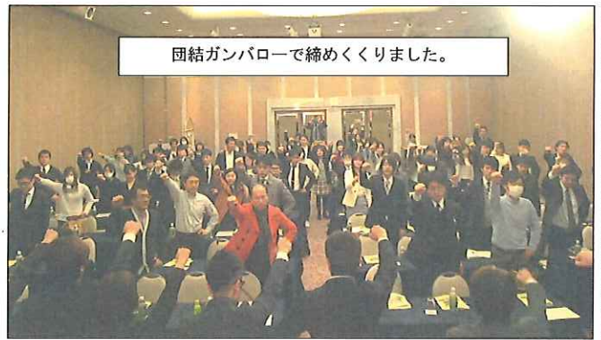
団結ガンバローで締めくくりました。

2月28日(水)、107回目となる定期大会を開催し、2017年度の活動報告・決算、2018年度の運動方針・予算について審議・採決し、新たな執行体制で活動に取り組むことを確認しました。出席いただいた代議員の皆さんからも多くの質疑・提案があり、活発な議論となりました。今後の組合活動に対する真摯な意見・提案として受け止め、今後の課題としてできることから見直しを検討していきます。