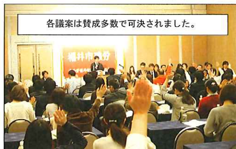
各議案は賛成多数で可決されました。